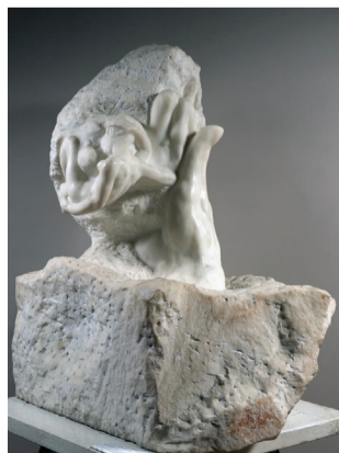
Auguste Rodin, La main de Dieu (La création) , vers 1896-1902 ; marbre, 94 x 82,5 x 54,9 cm ; Musée Rodin, Paris, France